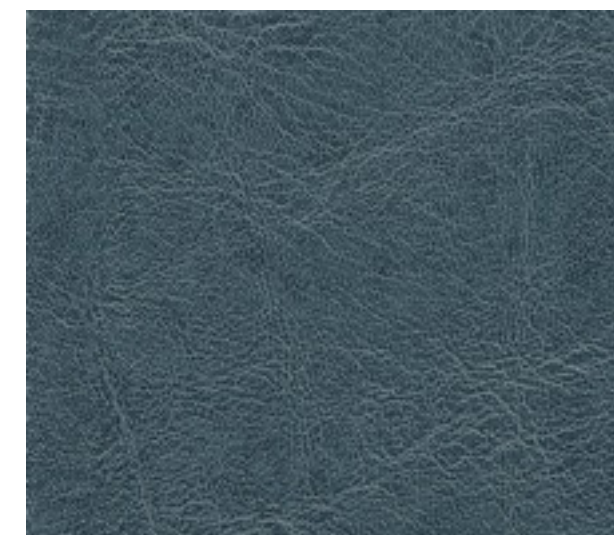
sea blue F6411232