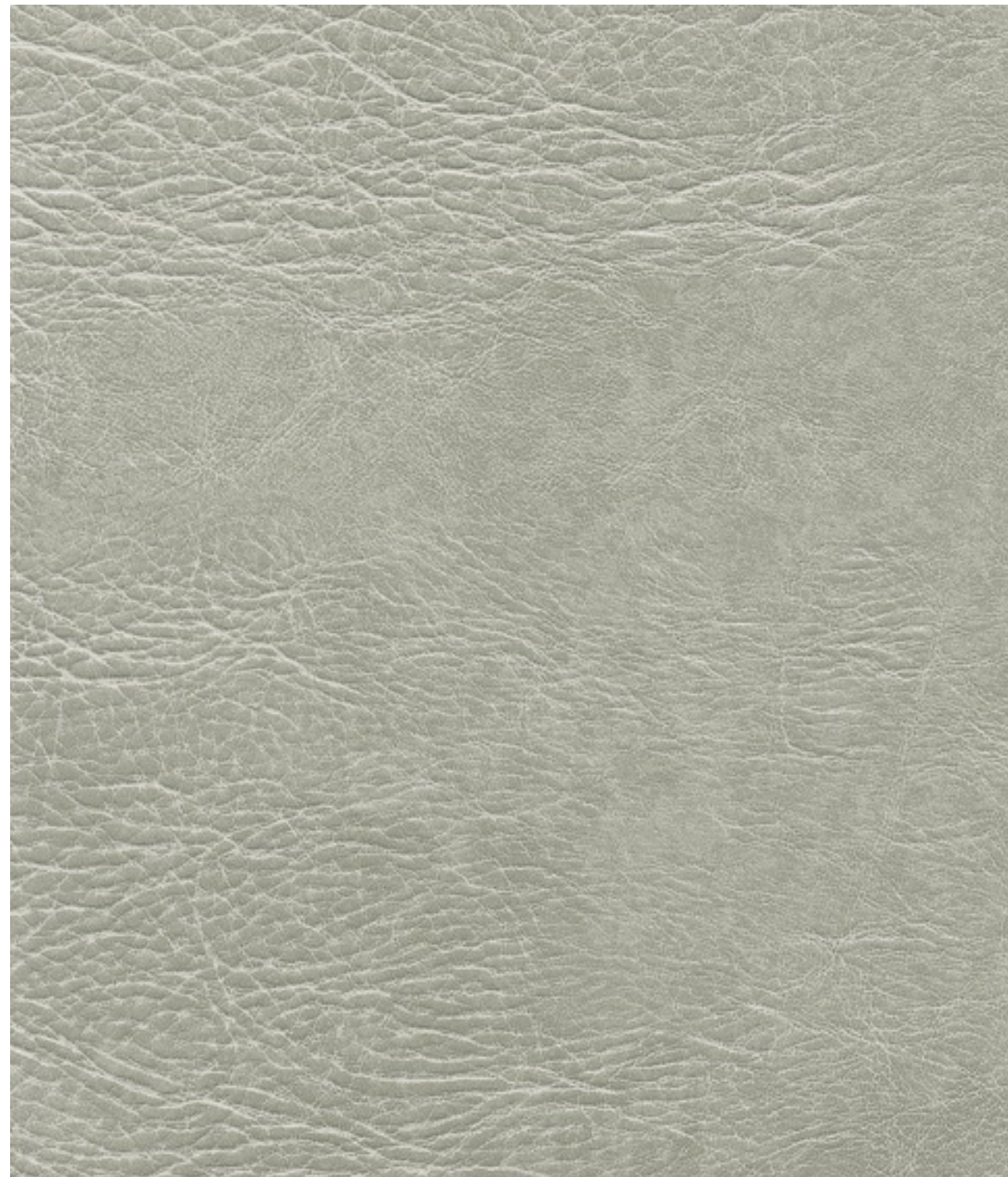
skai® Pavinto lightgrey F6411233

El producto para tapizado de alta calidad skai® Pavinto está dotado de una estética de cuero vacuno que imita los roces de un uso intenso. Sus roturas y desgastes visuales, pero también su grano variado, contribuyen a la autenticidad de este look vintage.