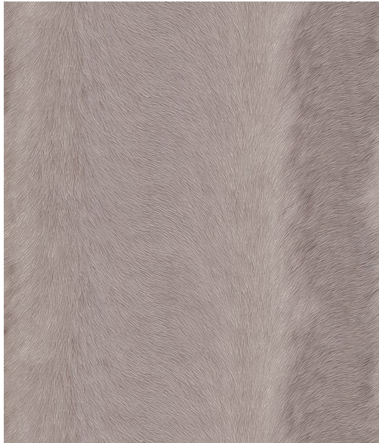
skai® Sofelto EN pebble F5076027

Una fina estructura de piel que emula la piel de un antilope africano. Los toques de color de sus valles, unido a sus crestas levemente brillantes, crean un noble efecto iridiscente. Su presencia visual impactante abre nuevas posibilidades de diseño en la aplicación de este material.