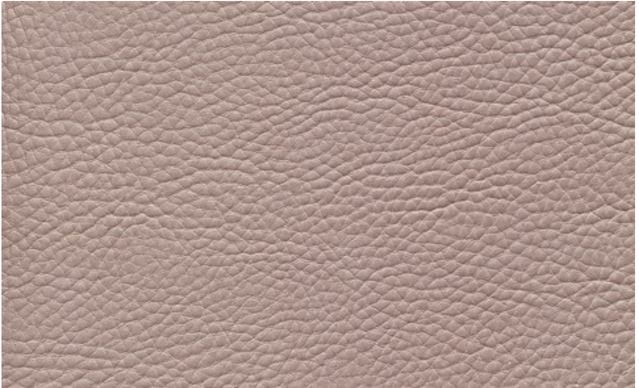
skai® Sotega Stars platino F5071001

skai® Sotega Stars es un material de tapizado de alta calidad dotado de un delicado grano de cuero y una estética muy atractiva. Se trata de un material especialmente flexible y se asemeja tremendamente a una napa de alta calidad. Su cuidada estética metálica le aporta modernidad, elegancia y distinción.