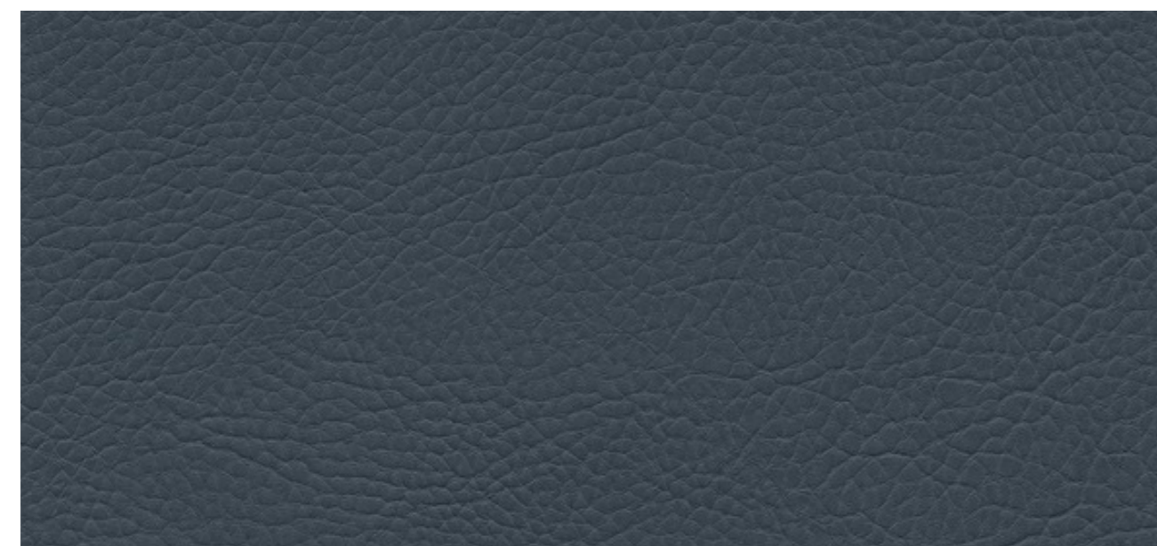
skai® Parotega NF stone blue F6461770

Un material skai® de alta calidad con textura de cuero clásico. Gracias a su estética y su tacto naturales, este material apenas se distingue del cuero auténtico. Este producto es especialmente idóneo e el ámbito de la decoración, las instalaciones y edificios públicos.