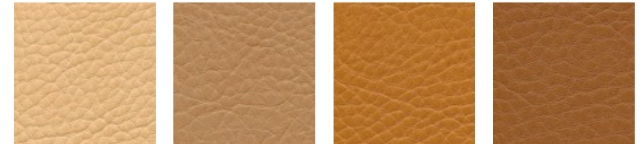
camel F5070635 sattel F5070647 nature F5071124 fuchsgold F5070693