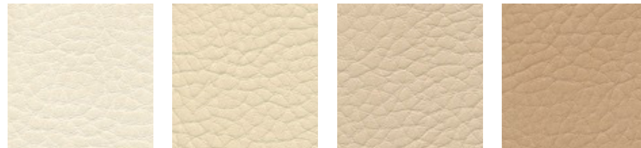
hellbeige F5070645 sandbeige F5071065 beige F5071173 kiesel F5071090