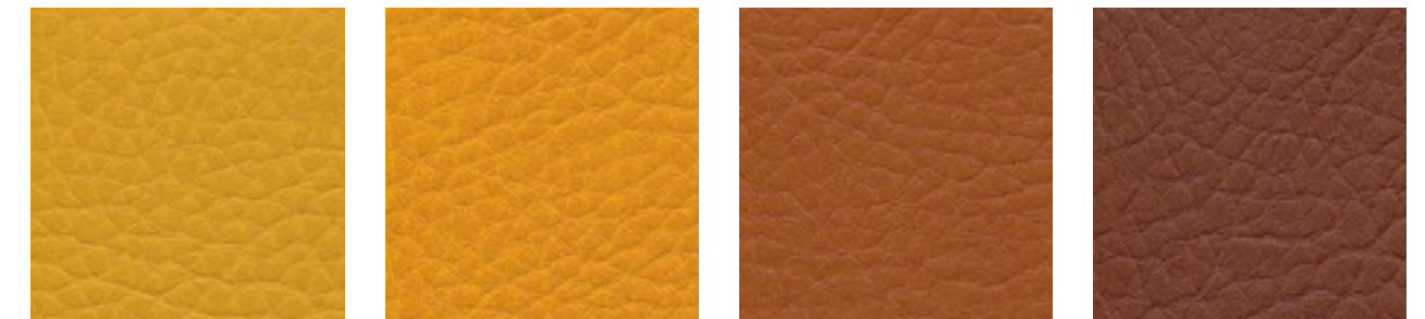
safran F5070909 mango F5070636 sherry F5070644 marone F5070640