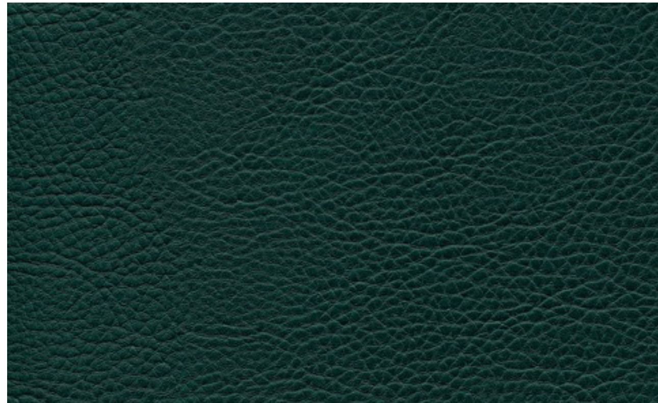
skai® Sotega forest F5070763

Un material de tapizado skai® de alta calidad con sensaciones de napa flexible y un grano de cuero clásico. Gracias a su estética y su tacto naturales, este material apenas se distingue del cuero auténtico.