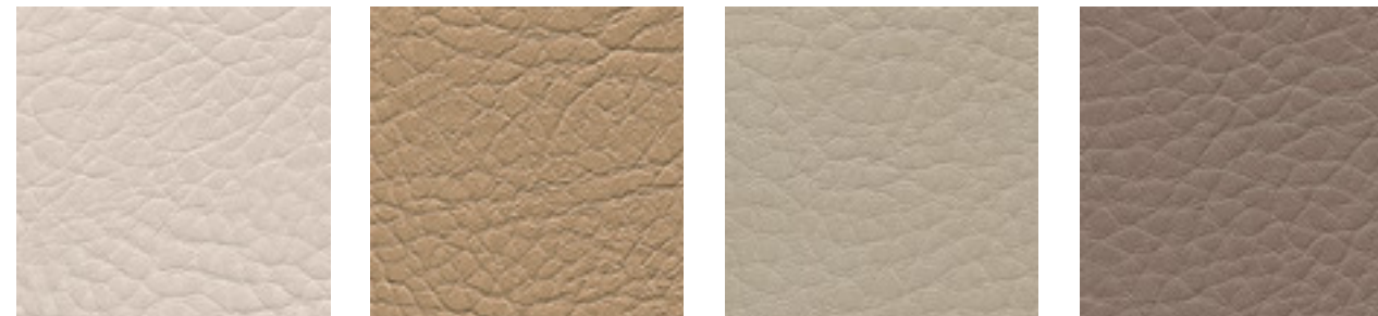
perle F5070911 sand F5071187 birke F5070767 fango F5071091