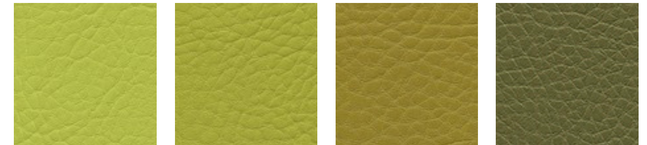
lightolive F5071016 limone F5071017 olive F5071125 taiga F5071188