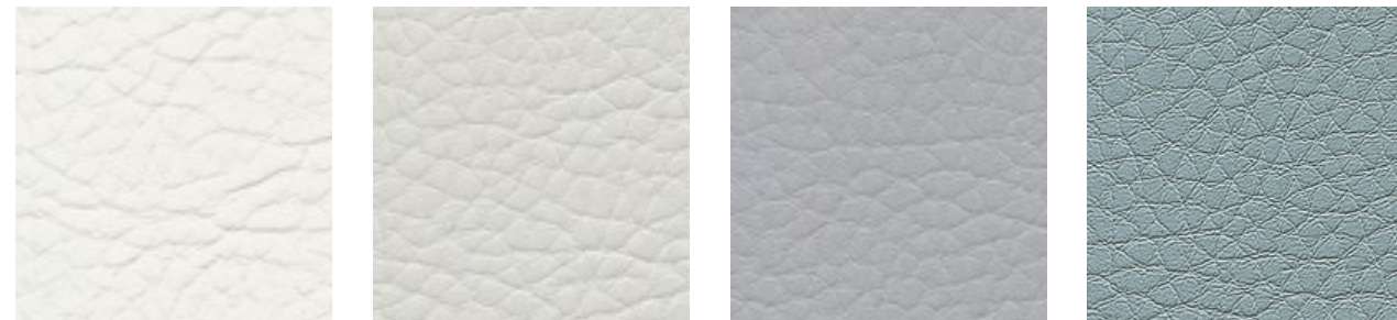
weiss F5070646 lightgrey F5071019 silvergrey F5071020 denim F5071189