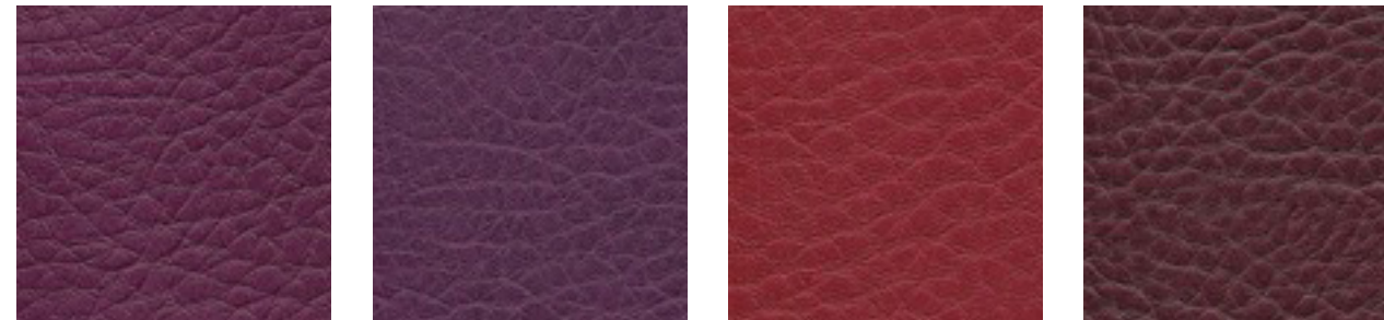
cyclam F5071126 amethyst F5070912 carmin F5070638 bordeaux F5070677