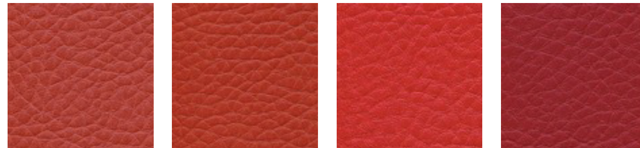
arancio F5070639 lachs F5070910 flame F5070637 kirsche F5070680