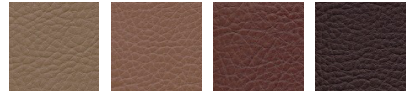
smoke F5070835 hazelnut F5071174 mocca F5070641 schoko F5070679